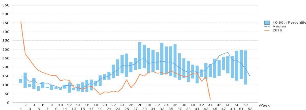
Figure 1 ผลการตรวจหาเชื้อไข้เลือดออกเดงกีสะสมจำแนกรายสัปดาห์ จากสถานพยาบาลเฝ้าระวังเฉพาะพื้นที่ จากกลุ่มตัวอย่างอาการคล้ายไข้เลือดออกเดงกีในแผนกผู้ป่วยนอก สะสมตั้งแต่ 1 มกราคม 2559 – 31 ตุลาคม 2559